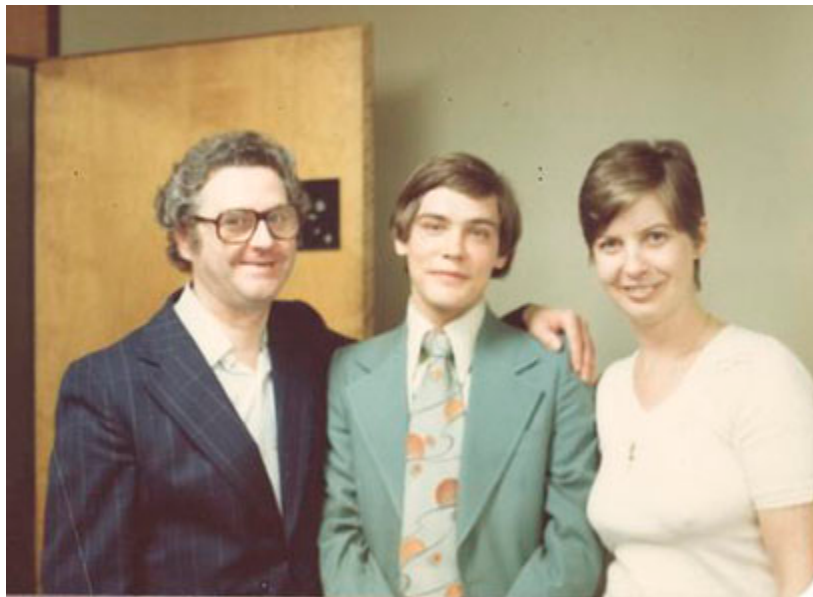
TAKEN IN MONTREAL, CANADA ON MAY 7TH, 1978